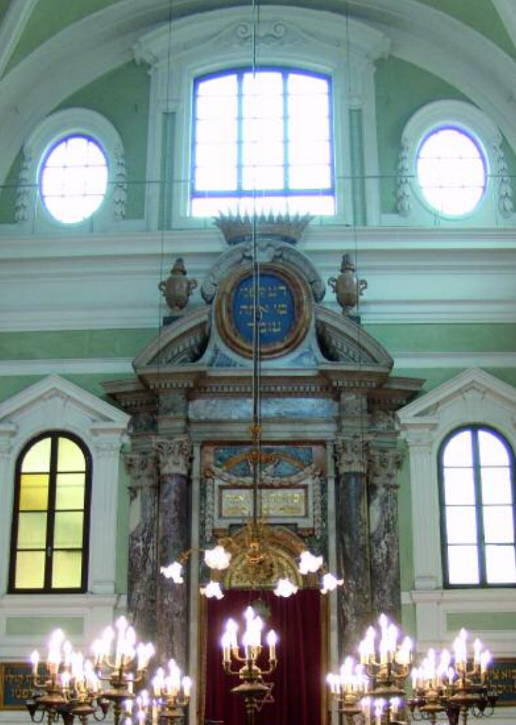
SINAGOGA DI SIENA