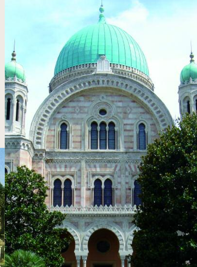
SINAGOGA E MUSEO EBRAICO DI FIRENZE

SIGMA CSC tel. +39 055 2346654 itinerariebraici@cscsigma.it Special extra openings upon reservation